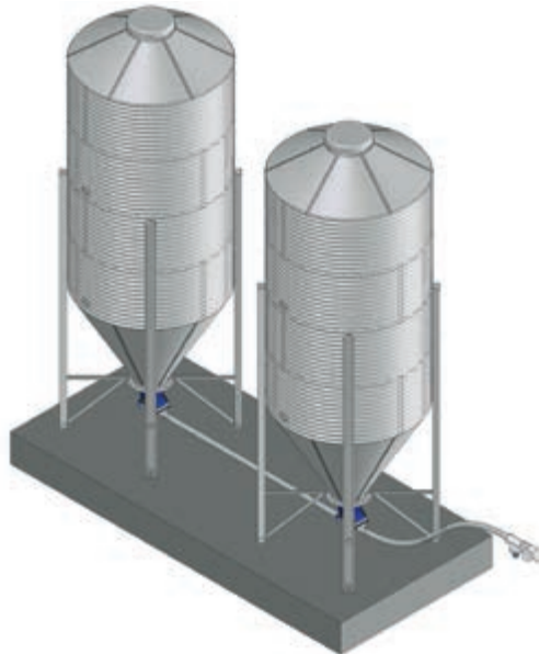
Eğimli ve çapraz aktarımlı helezon