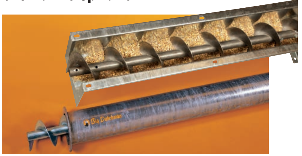
Yüksek taşıma kapasiteli yem helezonları

Daha yüksek kapasiteler veya 75°, ye kadar eğimler için, helezon ideal bir seçenektir. İstisnai durumlarda 90°, ye kadar olan eğimler bile taşınabilir (bu durumda maksimum helezon uzunluğu: 10 m).