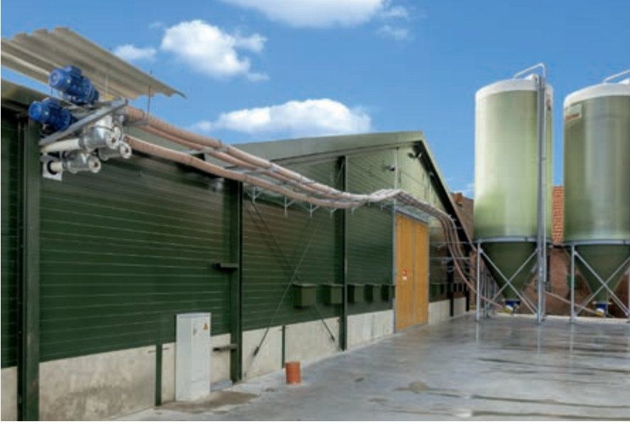
Silo'dan kümese kadar sadece FlexVey PUR kullanımı

ile yem tedarik edebilen yenilikçi bir ürüne sahip tek tedarikçi yapmaktadır. Dayanıklılık testlerimiz bunu açıkça göstermiştir.