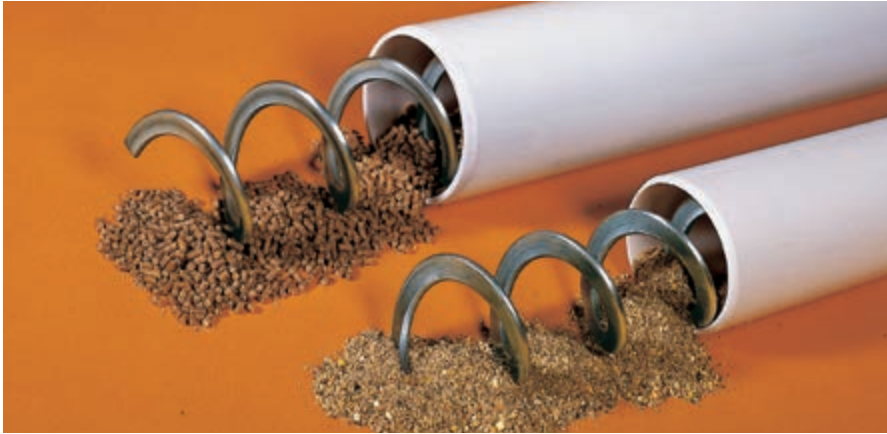
FlexVey taşıma sistemi – basit ve esnek

** dişli motoru ayrıca istek üzerine temin edilebilir; TS200'ün özellikleri dişli motoru için geçerlidir