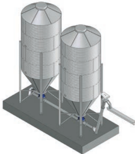
Güçlendirilmiş ara geçiş aktarmalı çift yönlü helikon