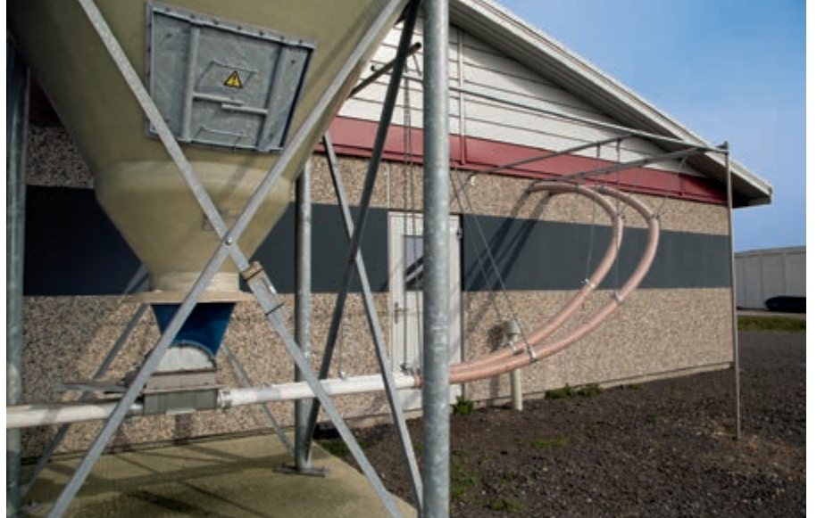
FlexVey PUR'un sert bir FlexVey borusuyla birlikte kullanımı