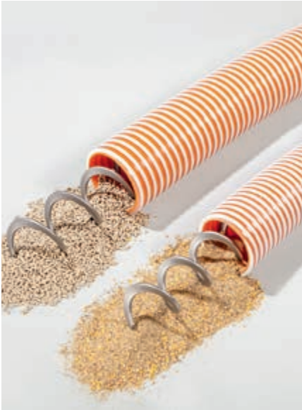
FlexVey taşıyıcı spiraller/helezonlar