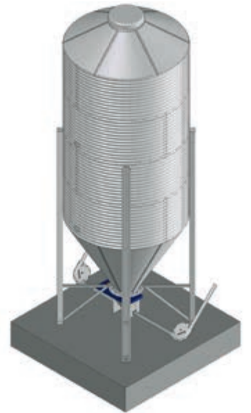
Konveyör zinciri (DR 850/DR 1500)