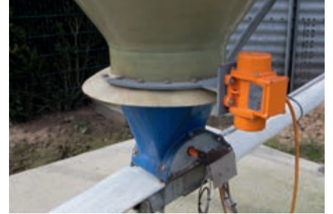
Elektrikli vibratörlü silo