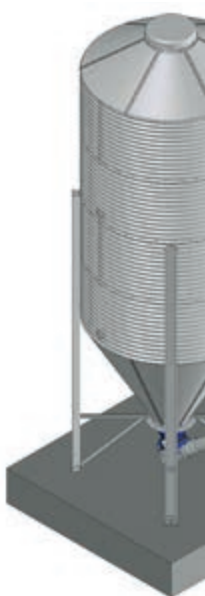
Eğimli ve çapraz aktarımlı helezon