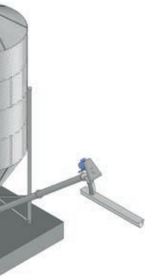
Boşaltma için boşaltma helikon