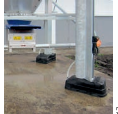
Şiddetli hava şartlarında güvenli tartım için silo ayağı kapağı